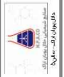
دالارپولان اربک - سالن ۵