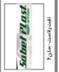
ایست لاست - سالن ۶