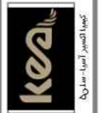
کمپنا تصویر آسیا - سالن ۵