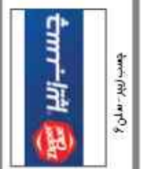
چوب جامی - سالن ۶